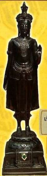
เนื้อทองเหลือง(รมดำ) บุชทองคำละ 3,999 บาท