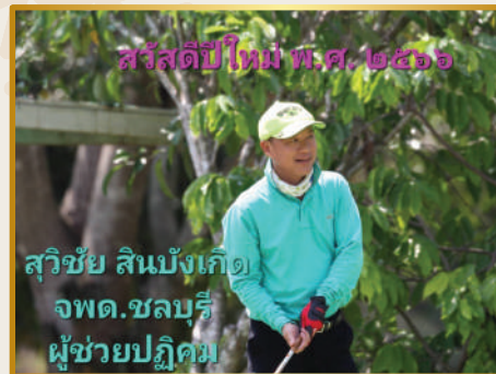
สวัสดิ์ปีใหม่ พ.ศ. ๒๕๖๖