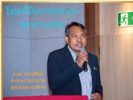
โชคดีปีเกาะ๒๕๖๖ ทุกท่านครับ