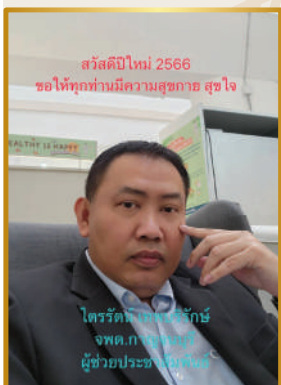
สวัสดิ์ปีใหม่ 2566 ขอให้ทุกท่านมีความสุขกาย สุขใจ