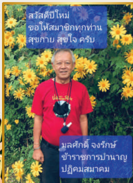
สวัสดิ์ปีใหม่ ขอให้สมาชิกทุกท่าน สุขภาพ สุขใจ ครับ