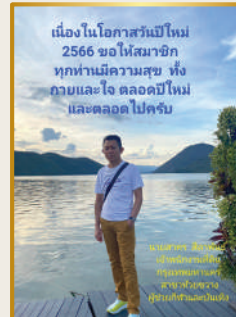
เนื่องในโอกาสวันปีใหม่ 2566 ของสโมสร ทุกท่านมีความสุข ทั้ง กายและใจ ตลอดปีใหม่ และตลอดไปครับ