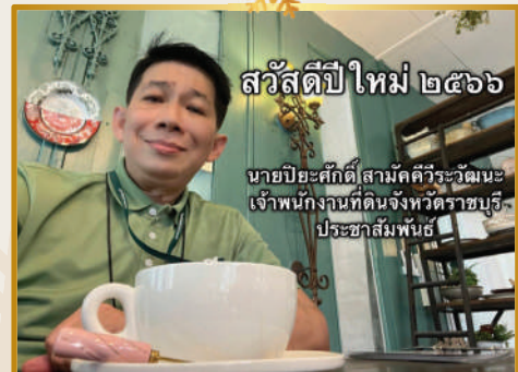
สวัสดิ์ปีใหม่ ๒๕๖๖