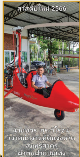
สวัสดิ์ปีใหม่ 2566