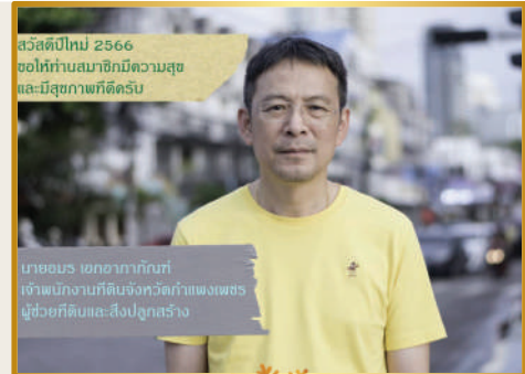
สวัสดิ์ปีใหม่ 2566 ขอให้ทุกท่านมีความสุข และมีสุขภาพที่ดีครับ