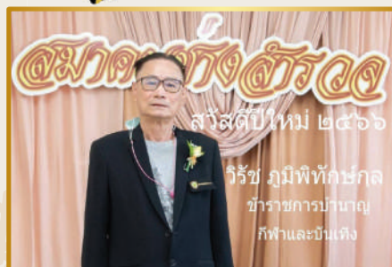
@สมาคมกอล์ฟ สวัสดิ์ปีใหม่ ๒๕๖๖