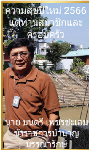
ความสุขปีใหม่ 2566 แต่ทานสมาชิกและ ครอบครัว